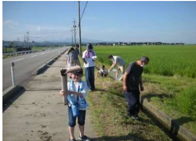
子供会のゴミ拾い