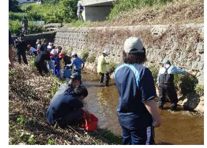
粟ノ保小学校生き物