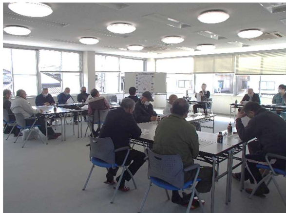
町会長・区長で計画（案）策定

令和5年度活動は、各地区の町会長、区長で施設点検を行い、計画策定後の4月6日より活動を行っています。