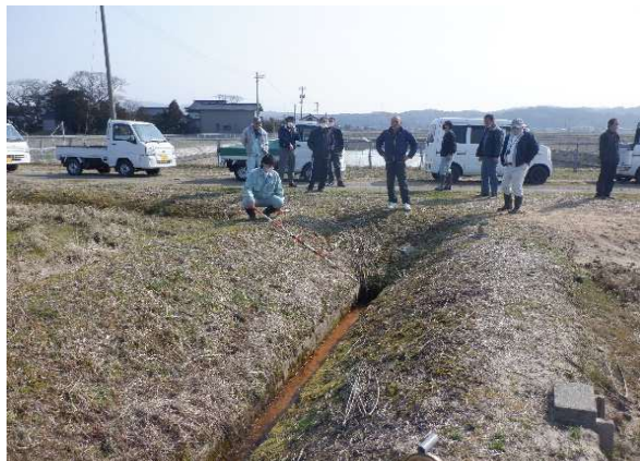
各地区の町会長、区長で施設点検