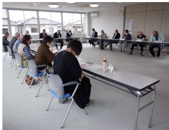
第1回運営委員会 計画策定承認